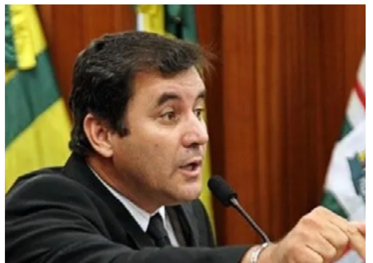
Clécio Alves: críticas ao presidente Lula