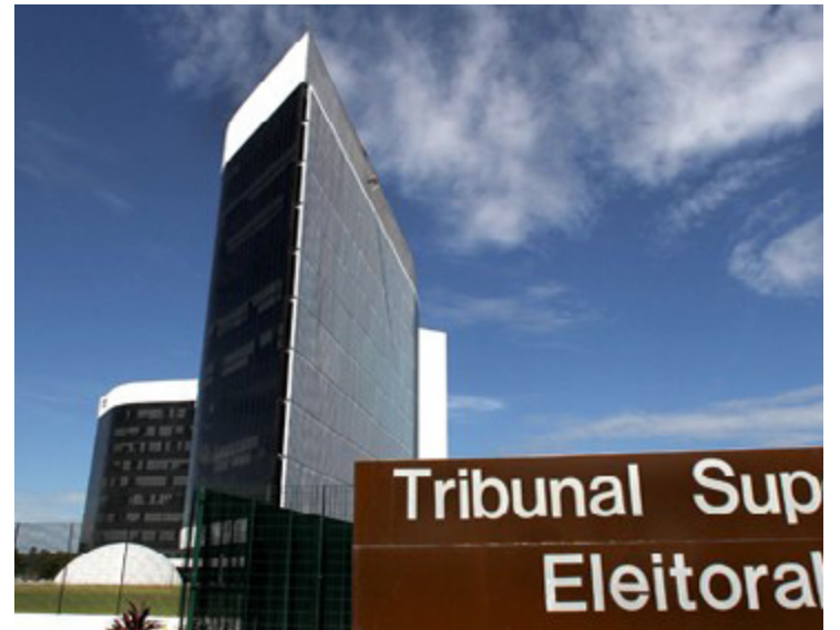
Alexandre de Moraes, presidente do TSE, será responsável pelo CIEDDE