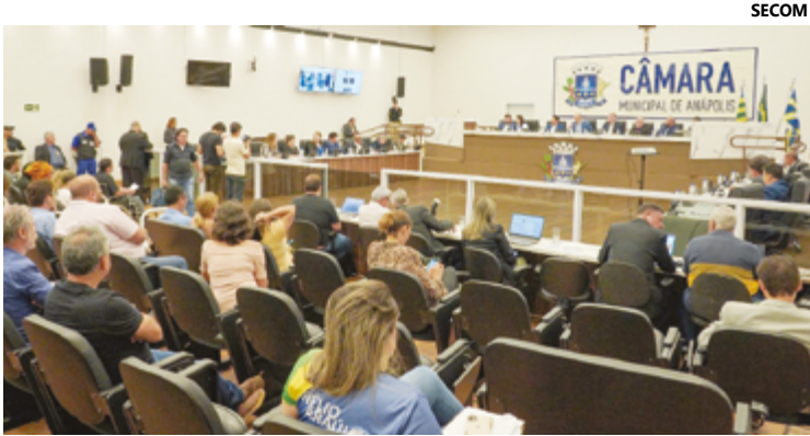
Sessão extraordinária está agendada para as 10 horas desta sexta-feira, 15, com transmissão ao vivo pelo canal da TV Câmara no Youtube