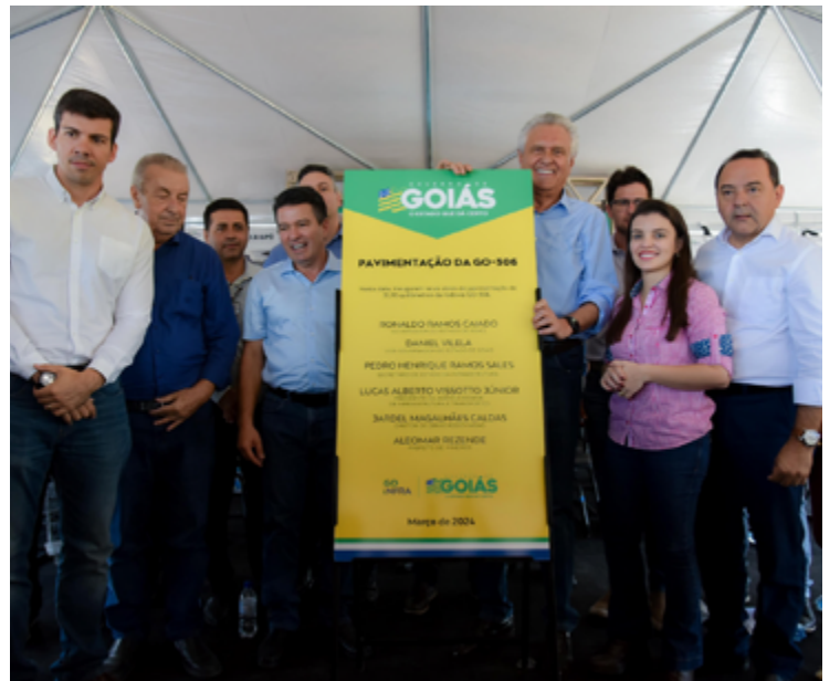
Governador Ronaldo Caiado realiza entregas em Mineiros: “Estamos integrando uma das regiões mais produtivas do Estado”

Prefeito de Mineiros, Aleomar Rezende disse que as obras eram aguardadas há 50 anos pelos produtores locais. “O governador veio aqui há dois anos e lançou a obra. Agora concluiu. Tudo que Caiado tem feito é de alto padrão, a exemplo dessa estrada”, comentou ele, acrescentando que “o que Mineiros precisava, o governador já fez ou está fazendo”.