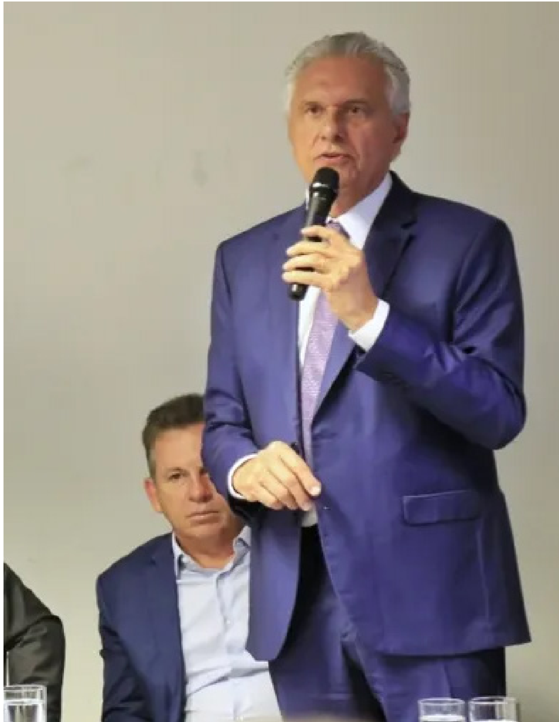
Ronaldo Caiado: União Brasil precisa recuperar a normalidade para as eleições municipais

Bivar é desta ala do antigo PSL, que ao romper com Bolsonaro no passado perdeu for-