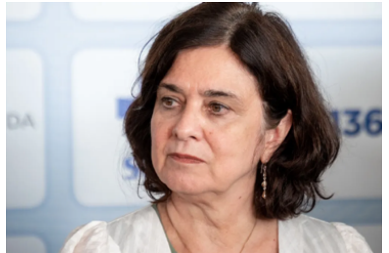
Nísia Trindade, titular da pasta da Saúde no terceiro governo Lula

Na avaliação de especialistas, a falta de representação feminina na política é o principal moti-