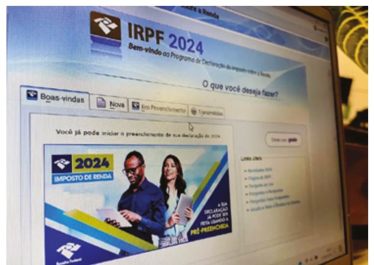
Prestação de contas é obrigatória para todos aqueles que receberam mais de R$ 30.639,90 em 2023; toda movimentação na Bolsa deve ser declarada

Em Anápolis, a Receita Federal estima que 90 mil pessoas devem prestar contas com o leão neste ano. O prazo para a entrega da declaração do IRPF encerra no dia 31 de maio, após a data, o contribuinte está sujeito a multas, problemas no CPF, entre outras consequências.