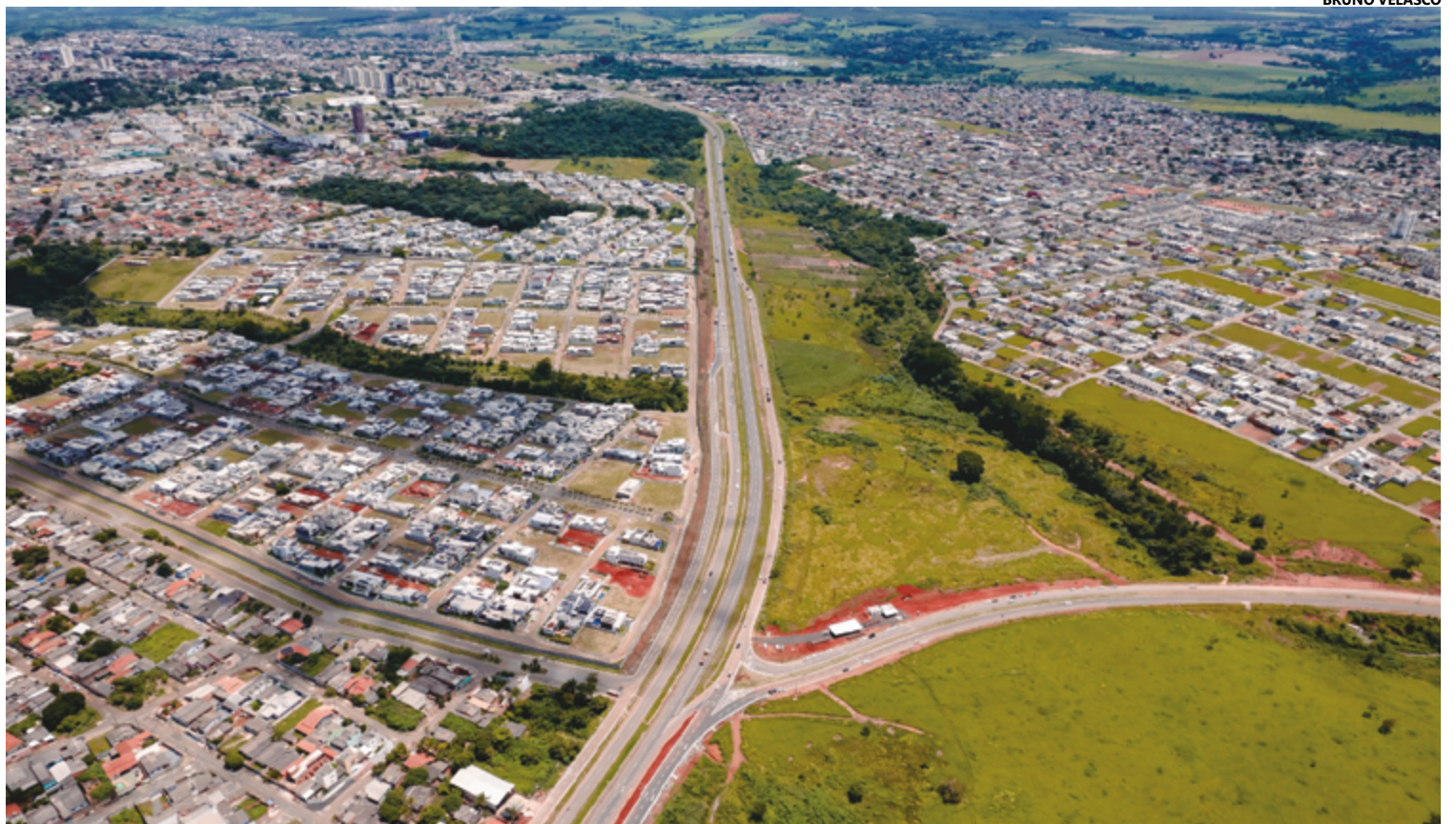
Para execução da obra são investidos mais de R$ 38 milhões; aproximadamente oitenta mil pessoas serão beneficiadas, em dezenas de bairros

Nas últimas semanas algumas intervenções já haviam sido feitas nas vias paralelas da BR153, na região onde é construída a trincheira, em trabalho conjunto da prefeitura e a Ecovias do Araguaia. A Equatorial Energia também providenciou a extensão do cabeamento de energia elétrica ao canteiro de obras. A Ecovias, com o apoio