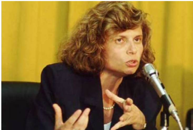
Zélia Cardoso de Mello: ministra da Economia no governo Fernand Collor

A pesquisadora coletou no portal da Presidência da República registros de quem foi nomeado e exonerado. Depois, confirmou as informações no Diário Oficial. Quem ocupou