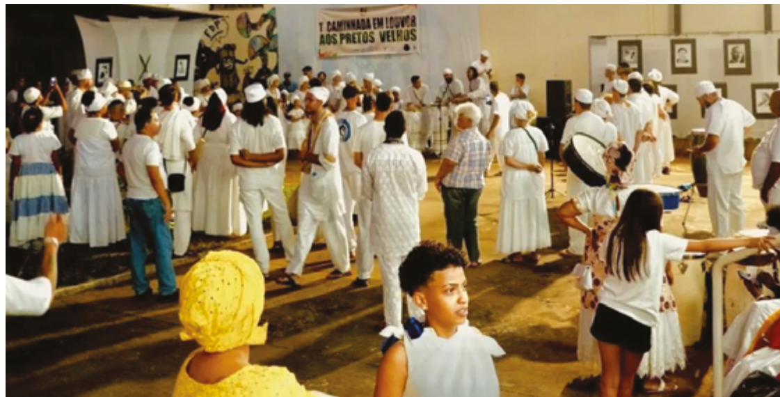
Encontro cultural integra calendário anual, combate racismo religioso e valoriza cultura ancestral africana

“É um momento dos povos de terreiro, dos povos de matriz africana, manifestarem a sua cultura. O foco do evento é cultural, não é litúrgico. Então, quem for pode contar com muita energia positiva, com