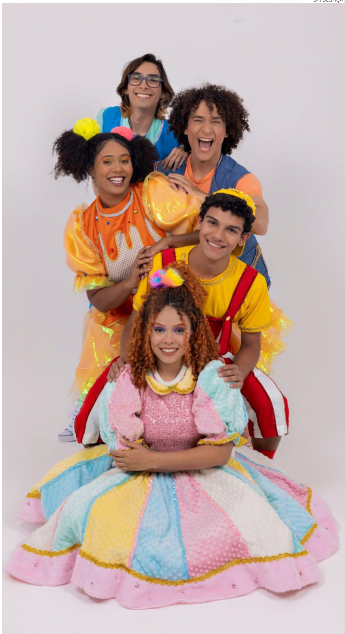
Espectáculo resgata universo lúdico cantado pelo grupo Balão Mágico, sucesso nos anos 80

Daí, afirmam, obras que promovem uma conscientização humanista e ensinam sobre respeito às diferenças, honestidade, lidar com situações estressantes, perseguir sonhos e combater preconceitos são tão necessárias. De acordo com a Flor do Cerrado, não há como negar que a Turma do Balão Mágico, grupo musical infan-