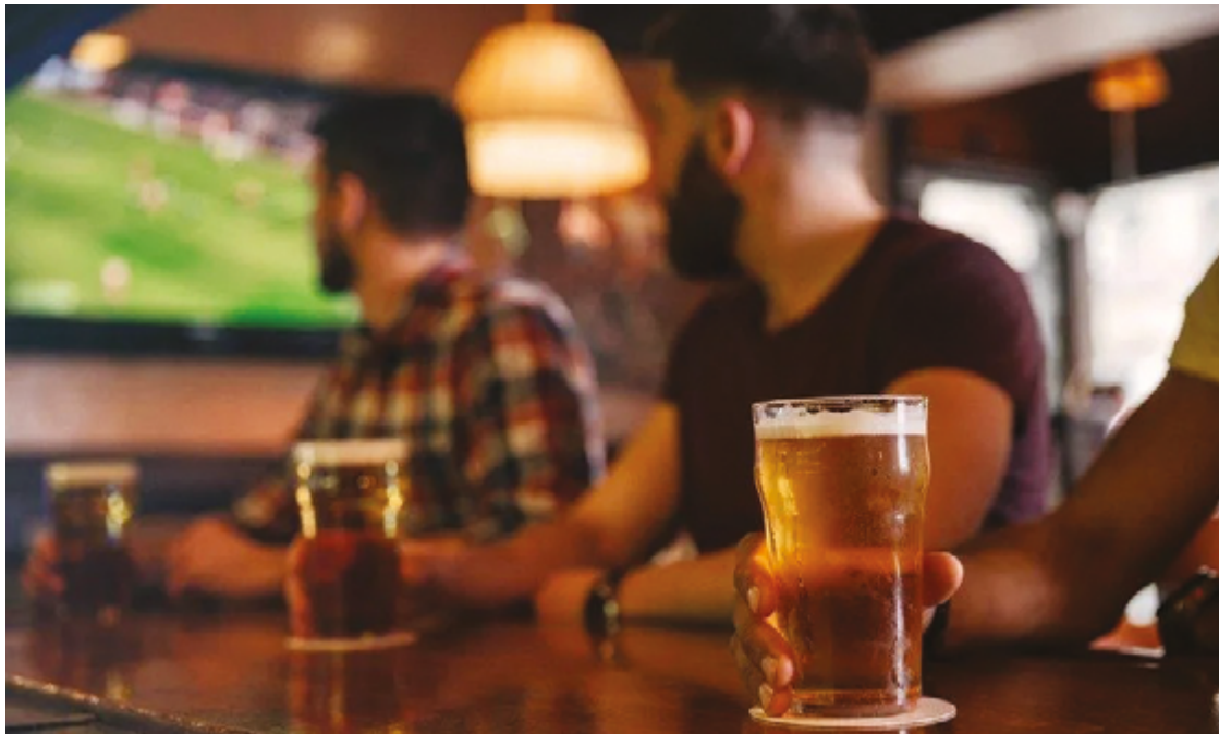
Movimento reduzido influenciou para que 29% das empresas relatassem perdas no mês de janeiro deste ano

"O período parecia mais positivo para o faturamento, mas essa expectativa não se concretizou. Na verdade, vejo que foi até um pouco pior que nos outros anos. Vimos a taxa de desemprego em um patamar um