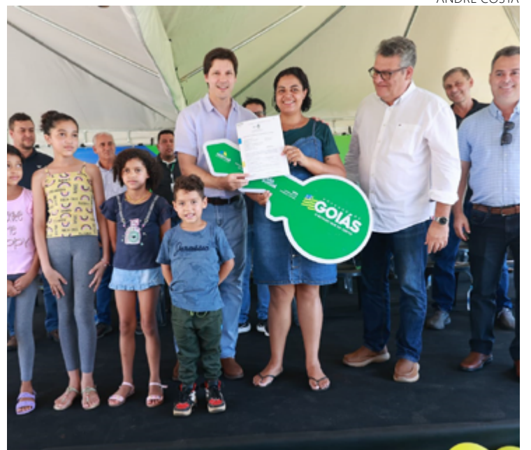
Daniel Vilela e famílias: 30 casas a custo zero em Chapadão do Céu

O programa de casas a custo zero, lançado em 2021, já alcançou 158 dos 246 municípios goianos. Somente neste ano de 2024, foram entregues 140 moradias para famílias de baixa renda. Em 2023 foram 1.028 unidades localizadas em 26 diferentes cidades, o que totalizou R$ 192 milhões em investimentos.